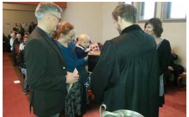
Dárek na památný den - obrázková dětská bible