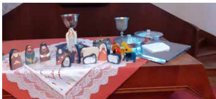
Vánoční stůl Páně.