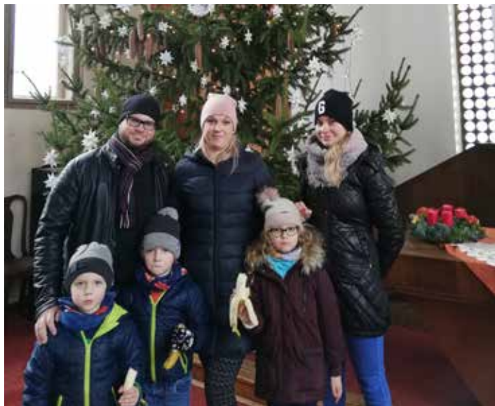
Vděční obdarovaní z Plzně.

epidemiologickým opatřením velmi omezená, takže jsme se loni už poněkolkáté vrátili do online světa. Škoda, ale co se dá dělat. Věříme, že příští rok bude pro celou planetu příznivější. Modlíme se za to.