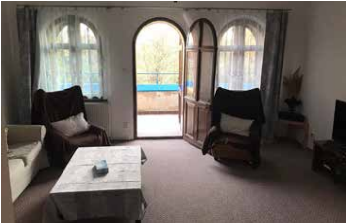
Kromě tří ložnic je tu i velká společenská místnost s televizí.