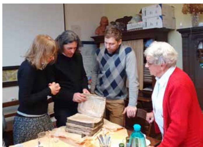
Pochlubili jsme se také našim pokladem - knihou z roku 1615.