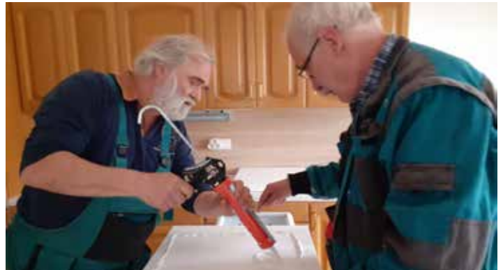
Nové stropy jsou kazetové.