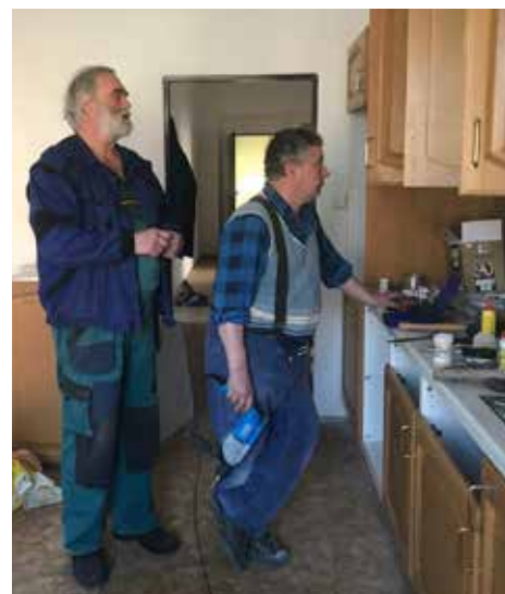
Milan s Pavlem novou linku osadili.