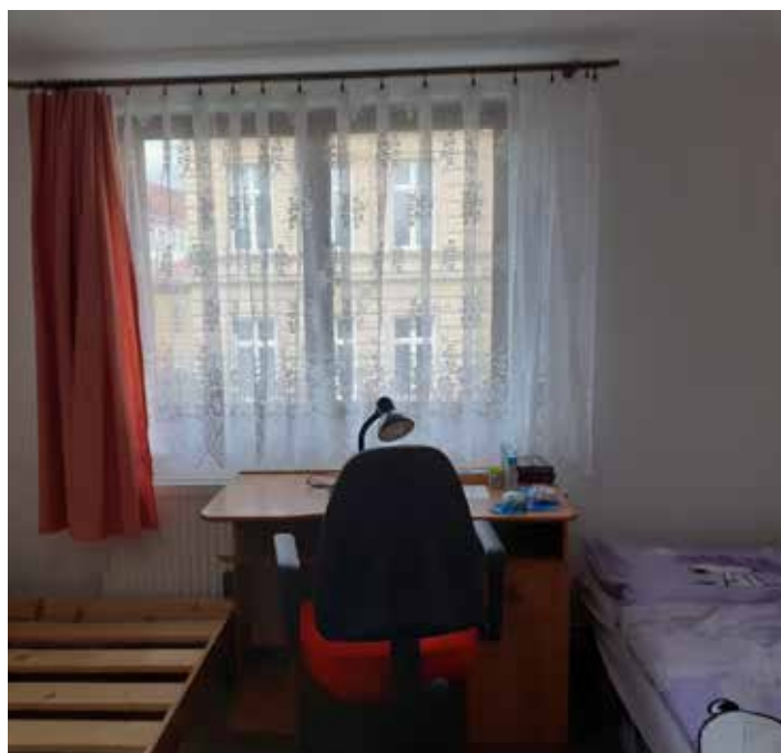
Pohled do jedné z ložnic.