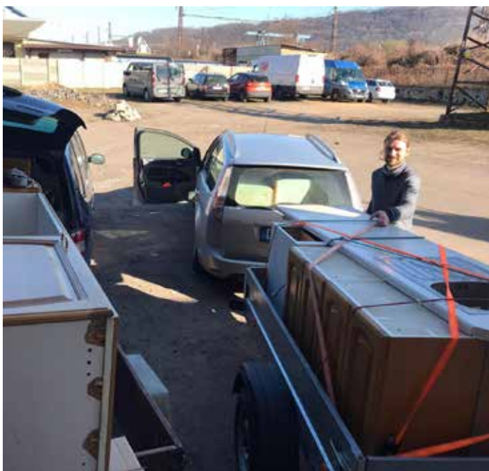
Jedeme pro kuchyň.