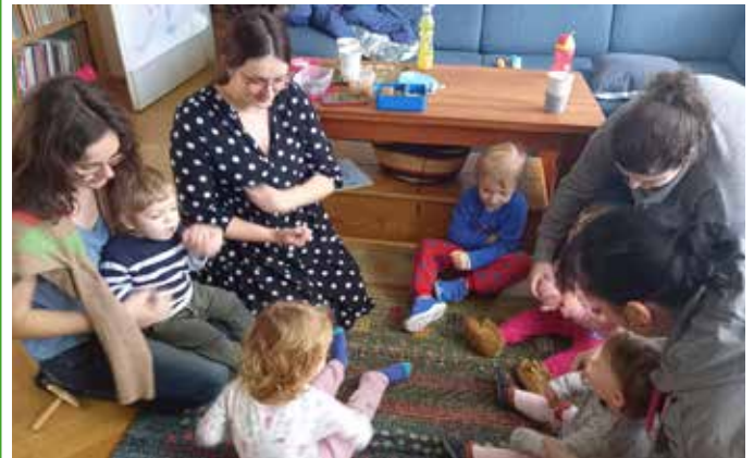
O čem si asi vyprávějí.