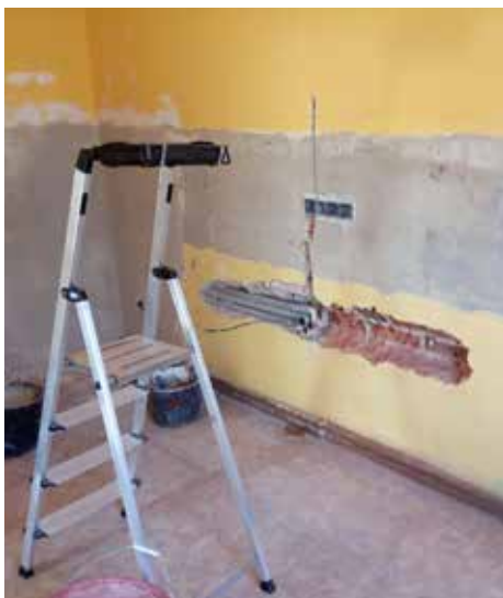
Měnily se všechny rozvody.