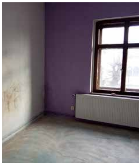
Bývalí nájemníci měli rádi fialovou.

do úklidu. Teď už skýtá nový byt zázemí čtyřem ženám a třem holčičkám z Dnipro a Záporoží. Jsou za to vděčné a my máme radost, že se dílo podařilo a mohli jsme pomoci. Dvě z dospělých žen již pracují jako kuchařky v teplické nemocnici. Dvě děti se chystají do mateřské a jedna dívka do základní školy. A co ještě pro naše přátele z Ukrajiny chystáme? Všechny jsme pozvali na festival Doma na zahradě, kde nám zazpívají ukrajinské národní písně a připravuje se příměstský tábor pro ukrajinské děti.