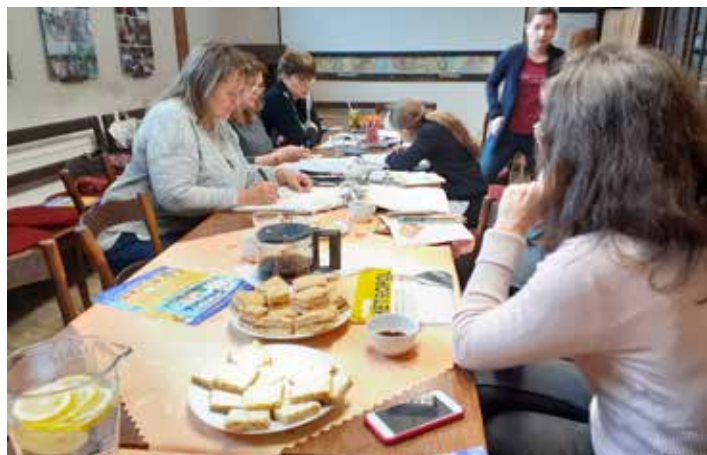
Naše ženy jsou velmi šikovné. Každá z účastnic si domů odnesla vlastnoručně nazdobenou tašku.