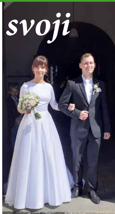
Mladému páru to moc slušelo.