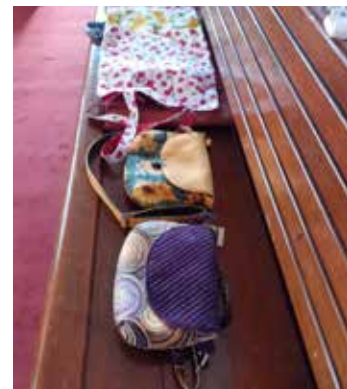
Všechny tyhle nádherné tašky a kabelky pocházejí z dílny Pavly Šeremetové. Výtěžek z jejich prodeje šel na konto pomoci Ukrajině.