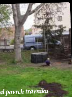
al povrch trávníku